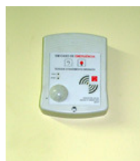
central de comando